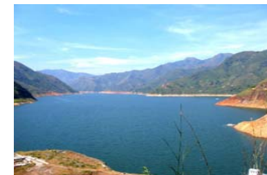
Embalse de la Salvajina – Municipio de Morales