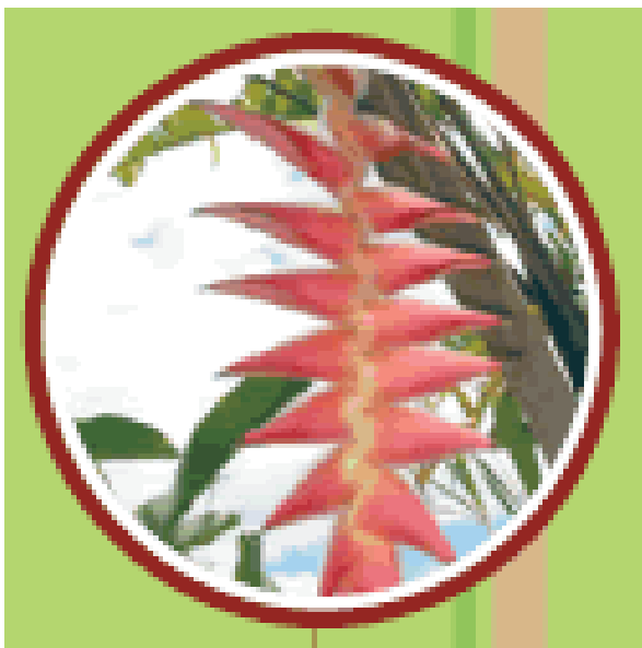
Inflorescencia pendular de Heliconia anthovillosa kress